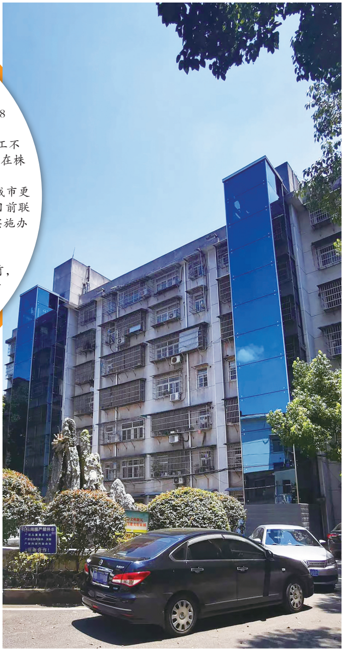
▲市内一处加装好电梯的老旧小区。

此外,超出小区土地使用红线范围的,自然资源和规划部门应核定超占部分权属,由申请人征得超占部分权属单位同意方可实施。