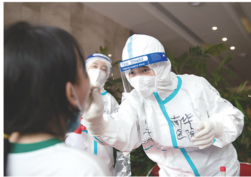
▲衡阳医疗队队员为居民做核酸检测采样。

本报讯(株洲晚报融媒体记者/谭昕吾 张媛)8月10日,是衡阳医疗队来到株洲的第七天。过去一周,这支来自衡阳的200名医护人员,累计完成25万人次的核酸检测采样。