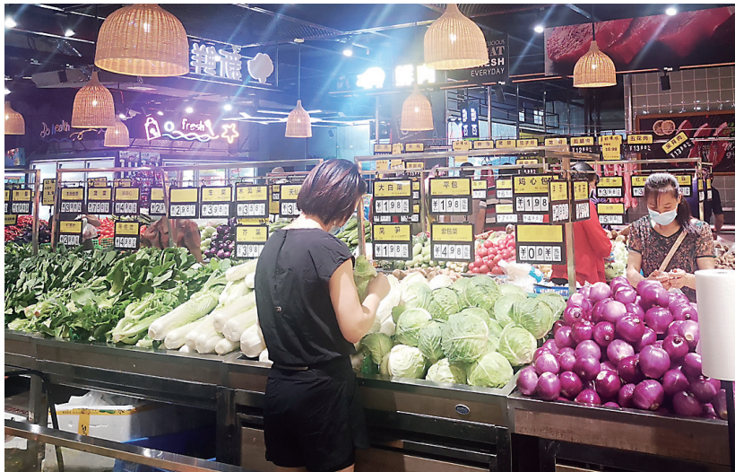
▲小而精致的社区超市,生鲜食品吸引了固定的消费者。

社区团购前景如何?记者采访多名资深团长、消费者和商超、农贸市场负责人,大家一致表示,不转型提升品质,低价策略走不长久。