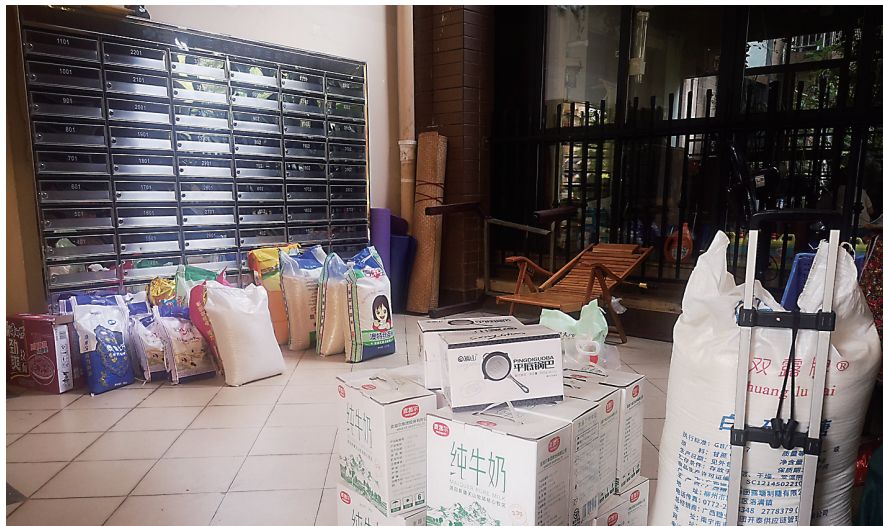
▲某社区团购店自提点,待居民自提的米和牛奶。