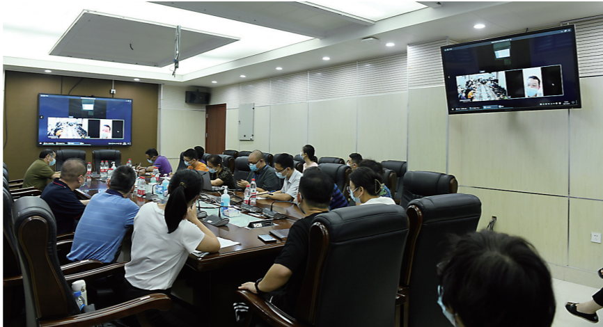
▲省市专家组对在院患者进行线上多学科讨论。通讯员供图

连日来,疫情牵动着市民的心。截至8月3日24时,株洲累计报告新冠肺炎确诊病例17例,无症状感染者2例。这些患者会被送到哪?又会得到哪些救治?8月4日,本报记者独家探访了株洲市新冠肺炎患者定点集中隔离救治医院(以下简称“市定点医院”)。