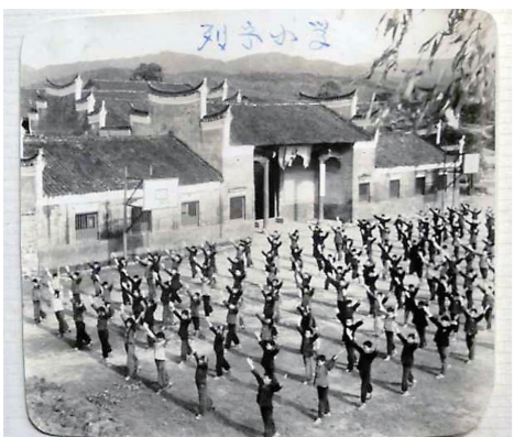
▲茶陵列宁学校,同学们在做操。