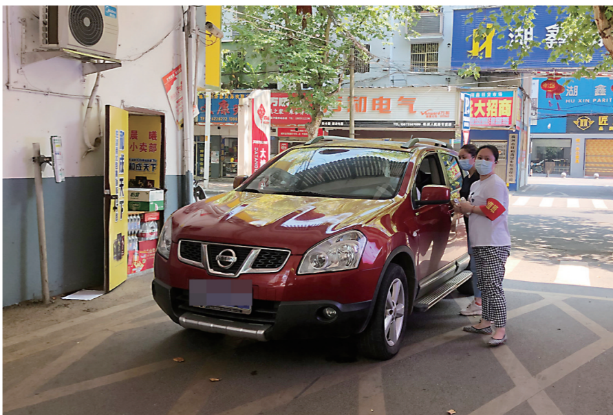
▲大塘冲小区入口,工作人员对所有进出车辆进行登记排查。

社区是疫情联防联控的第一线。为了控制阻断传染源,我市部分小区进行防控出入管理。虽然会给居民带来不便,但换来的是全社会的健康和安全。小区“守门人”的防控措施开展得如何?近日,晚报记者选择了几个小区进行了探访。