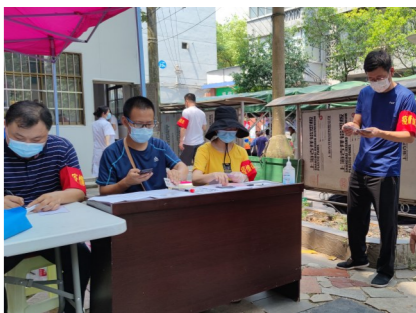
▲报社党员志愿者在大塘冲社区协助抗疫。

一天下来,虽然喉咙喊哑了,但对于志愿者们们的沙哑喉咙,不少居民称赞道:“这是检测点最动人的声音,让我们很有安全感。”