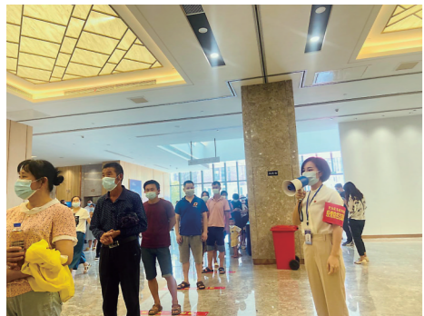
▲志愿者提醒大家保持距离。

目前,马家河街道实现了整个辖区疫情防控以及核酸检测宣传的全覆盖,街道负责人表示,现在该街道3个检测点,最快每小时可采集450人次核酸检测样本,每天可采集15000多个样本。