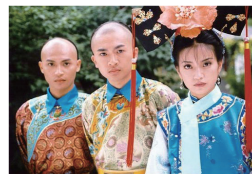
▲暑假神剧《还珠格格》,是“80后”“90后”的青春记忆。