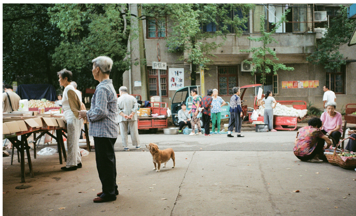
▲塑料厂生活区,吴先生的外婆家在这里。小时候的每年暑假,吴先生都在这里度过(资料图)。