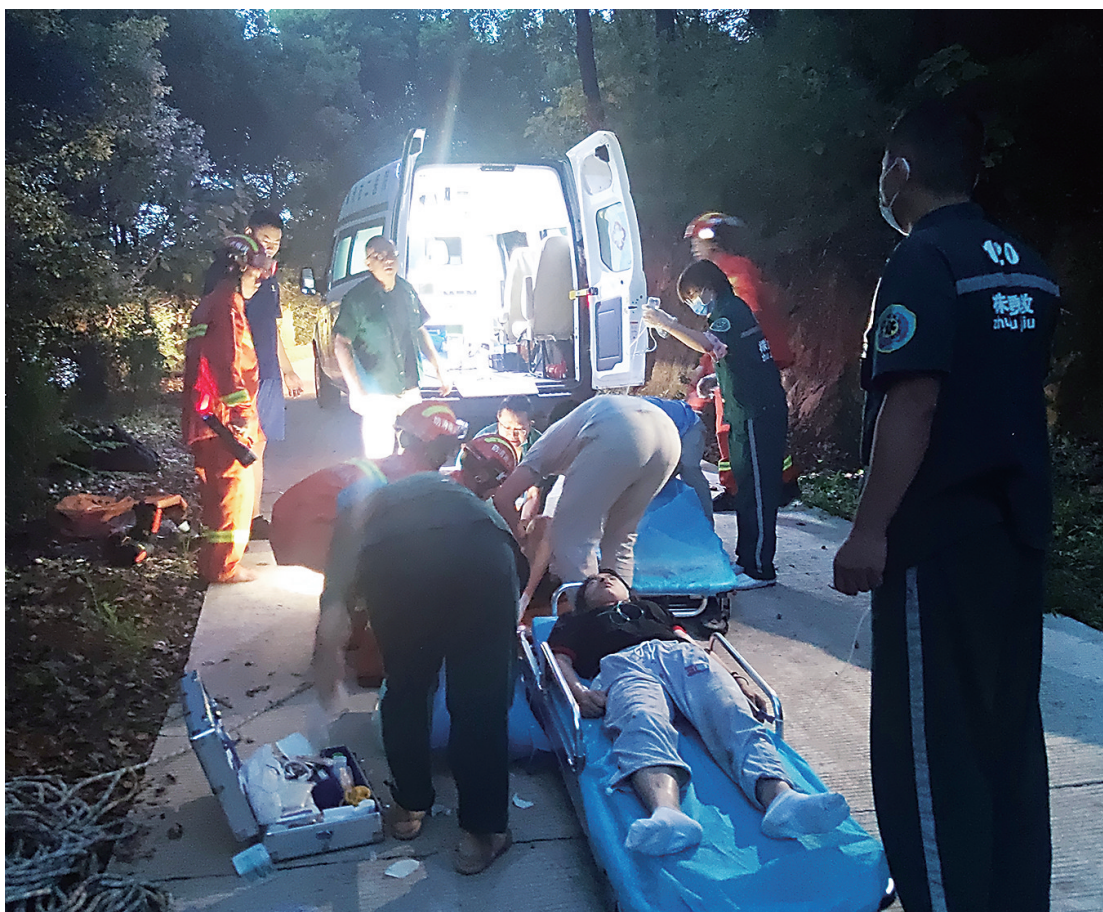
▲救援人员对受伤学生进行急救。

消防部门提醒,正值酷暑,发动机高负荷、长时间运转,容易引起车辆自燃。车主要定期对车辆进行检修保养,及时清理车内易燃可燃物品,切忌“带病”上路。