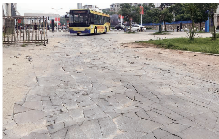
▲铺满石板的地面破烂不堪。记者/刘平 摄