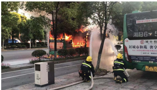
▲消防员扑救自燃的公交车。

醴陵市公共交通有限责任公司相关负责人表示,目前已经叫停同车型运营,并对该市所有新能源车辆进行安全隐患排查。目前,起火原因还在进一步调查中。