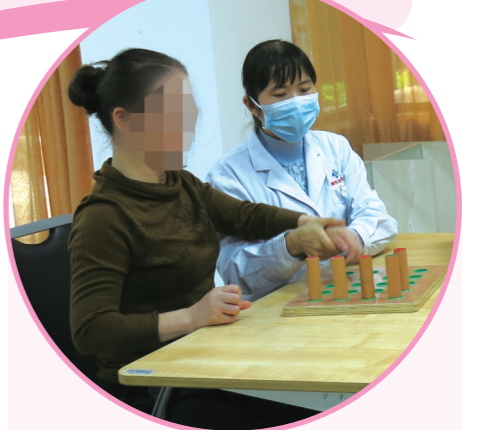
▲田心院区康复医学科医务人员指导病人做康复训练

提质改造后,田心院区能为田心片区的居民提供哪些医疗服务?有哪些特色专科?对田心片区乃至株洲发展有何意义?