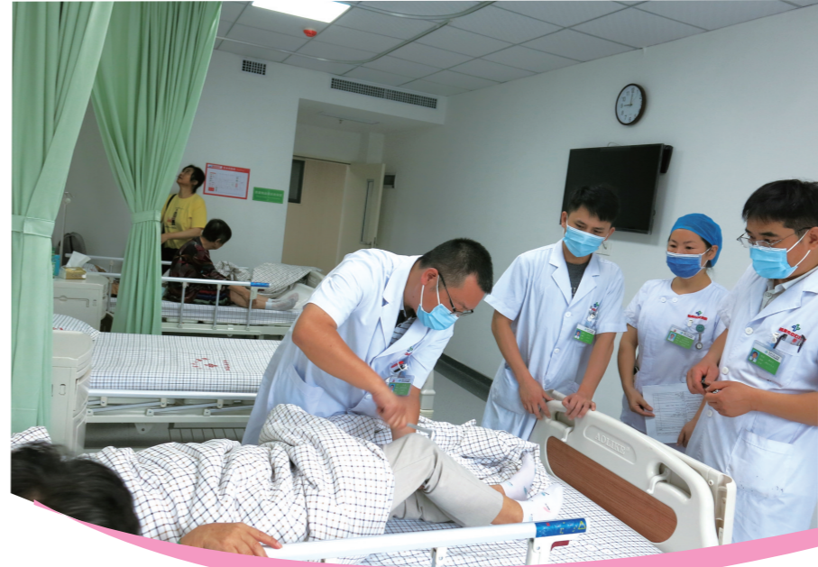
▲医生们在给患者做检查