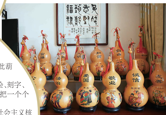
▲“社会主义核心价值观”作品。