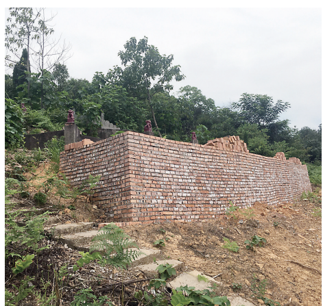
▲湾塘村四方土组,山上的一处墓地。

今年2月份,本报曾对湾塘村四方土组山体出现的硬化坟墓、建“活人墓”现象进行过报道。近日,记者回访发现,该处山体依然存在新建墓地、硬化坟墓现象,山上有植被被开挖,堆放砖块、沙子等建筑材料。