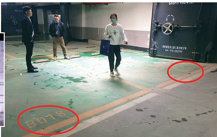
▲美的·蓝溪谷三期此前未整改的停车位编号。