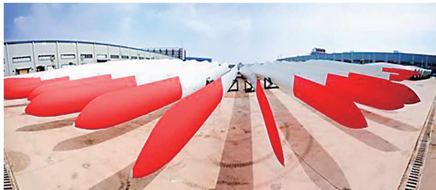
▲时代新材生产的风电叶片。资料图片

这种情况在株洲本地也能得到印证。“今年以来,不但是新注册证券用户增多,新开信用账户的投资者也增长明显。”一家本地券商工作人员说。另一家券商公司负责人介绍,本地投资者两融交易额也增长显著,数据有较大幅度提升。