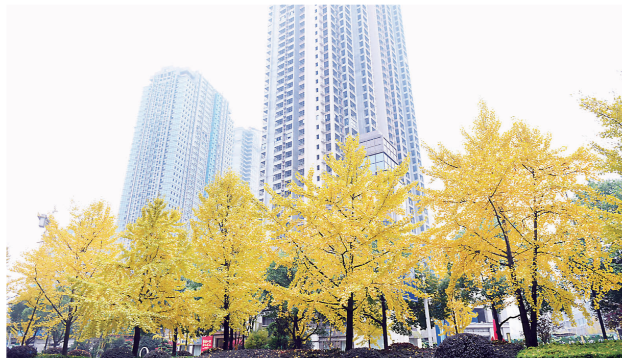
▲12月,庐山路上的银杏营造“金色大道”。

“以对历史对人民负责的担当和情怀改善生态环境,扎实抓好生态文明建设”,这是时代的命题,是株洲的使命。下一步,市生态环境局将以本次活动为契机,通过“线下+线上”的宣传模式,推进株洲生态文明建设步伐走深走实。