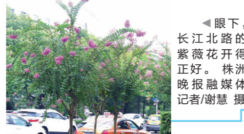
▲眼下,长江北路的紫薇花开得正好。

紫薇花的花期很长,每年从7月开始,至10月,花开不断,因此又叫百日红。宋代诗人杨万里曾写过:“似痴如醉丽还佳,露压风欺分外斜。谁道花无红百日,紫薇长放半年花。”