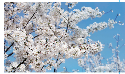
▲初春,新丰路的早樱绽放。

此外,湘江风光带河西段往枫溪大桥沿线,近六七公里长的江边,也能感受浪漫的“樱花走廊”。