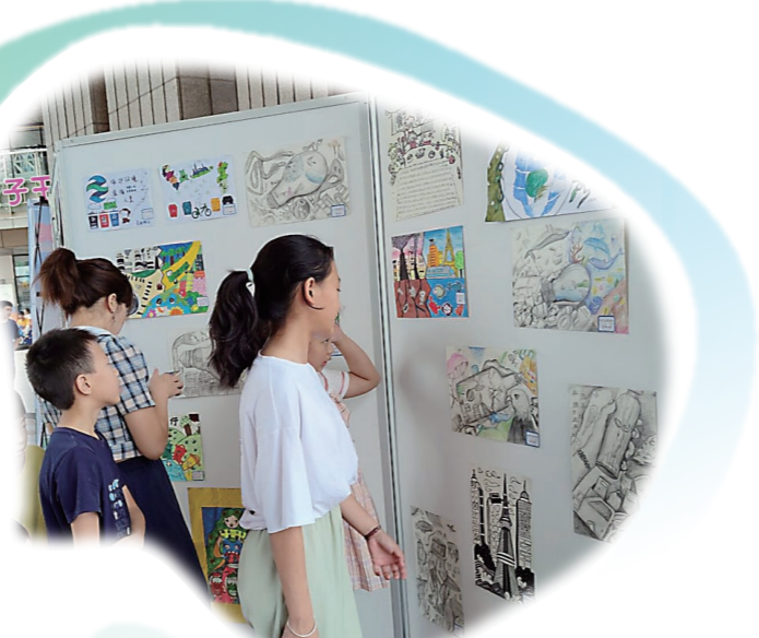
▲孩子们欣赏画作,生态种子在心间悄然埋下。

通过对污染场地一寸一寸地治,全力对土壤污染存量、控增量、防变量,全面消除环境风险隐患,累计完成受污染耕地安全利用76.3万亩,耕地安全利用率达到91%以上。株洲以战天斗地,实现了生态环境的翻天覆地,以伤筋动骨,实现了城市的脱胎换骨,演绎了从传统工业城市到中国绿水青山典范城市的华丽蝶变。