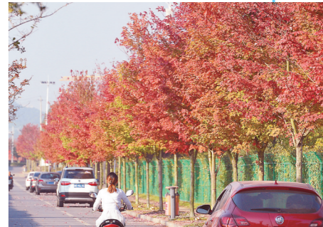
▲神农大道的枫叶红了。

这里的红枫树叶随季节而变,初春嫩红,夏季叶色由微红转浓绿,入秋后叶色逐步转深红,尤其霜降过后最为美丽。