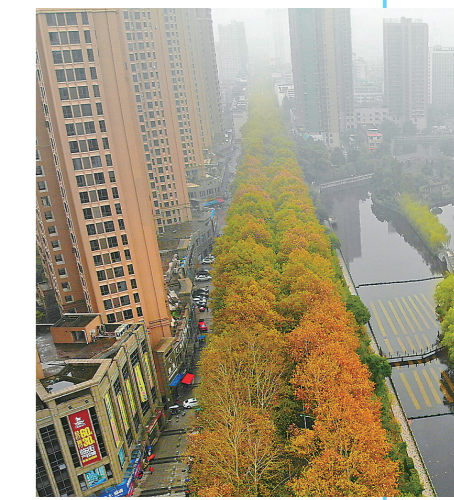
▲11月,梧桐叶儿黄。记者/唐剑华 摄(资料图)

还有一处,便是建设北路近铜藕路口沿线,约600米的行道两侧,栽种有118株法国梧桐。夏日遮荫,秋日赏景。