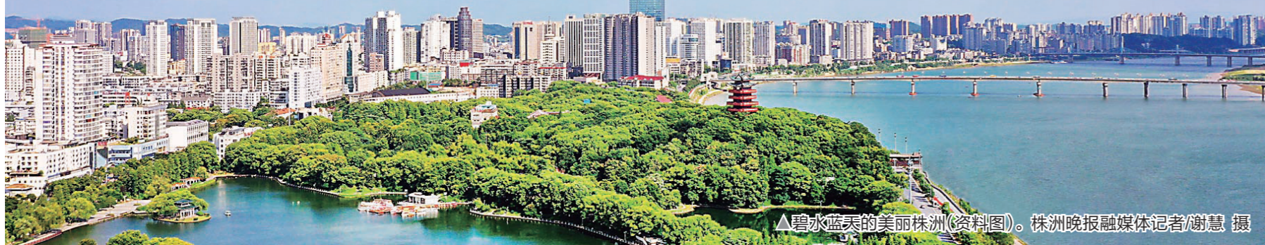
▲碧水蓝天的美丽株洲(资料图)。

2011年3月21日,习近平同志到我市湘江风光带考察湘江综合治理工程的周边区域,今年正好是十周年,更是中国共产党建党100周年。为充分展示习近平生态文明思想在株洲的生动实践,今年4月,市生态环境局、市文明办联合千金药业集团举办“千金杯”生态文明绘画比赛,并先后向全市各个阶层征集了259幅作品。“本次画展的作品全部由市民完成,通过画笔的一勾一点,讲述了株洲生态文明建设的生动故事;通过水彩的一涂一抹,展示了株洲生态环境质量的显著改善;通过画纸的一景一物,表达自己对美好生态的无限向往。”市生态环境局负责策展的工作人员介绍。