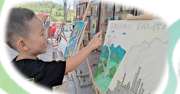
▲一名在现场参观的小朋友饶有兴趣地念出一幅画作上“共建绿色株洲,你我共同努力”的主题词。