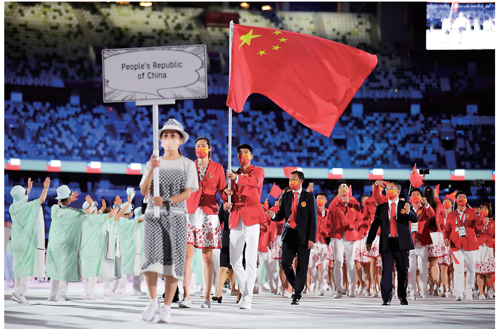
7月23日,第32届夏季奥林匹克运动会开幕式在日本东京举行。这是中国体育代表团入场。本届中国体育代表团由777人组成,参赛运动员431人,创造了中国代表团境外参赛人员新纪录。全团运动员平均年龄为25.4岁,参加过奥运会的有138人,其中有24位奥运冠军领衔。