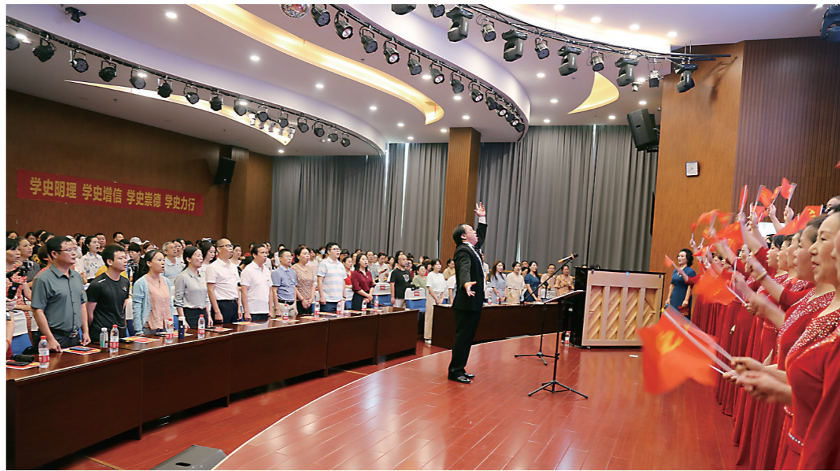
全体人员合唱《没有共产党就没有新中国》。

毕亚炜,国家二级心理咨询师,国际心理剧考试委员会认证导演,株洲市中医伤科医院创伤后病人心理干预课组负责人,株洲市红十字会心理援助志愿服务队队长,天元区关爱社区心理服务中心心理咨询师,湖南省红十字会“四星”志愿者。