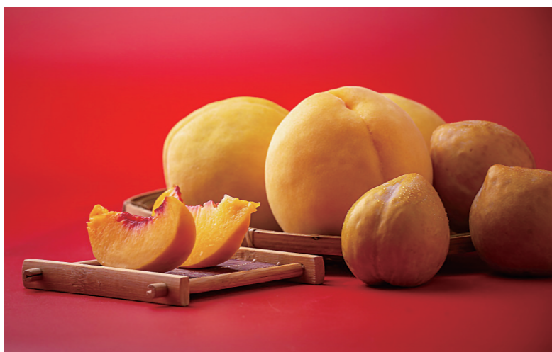
▲炎陵高山黄桃,5斤装78元/箱;10斤装108元/箱,产地直发。

同》。同时也在炎陵县炎陵黄桃产业协会进行备案,获得了线上售卖许可。慈善超市承诺,线上每卖出1箱炎陵黄桃,将从中拿出10元作为金秋助学捐款。在销售季完成之后,一次性将此次“惠农助学”卖黄桃所得的捐款,通过株洲晚报交到贫困学子手中。同时,还将通过石峰区慈善超市的微信公众号公布所有参与此次爱心助力的名单,并对购买10箱以上的单位颁发捐赠证书。 据悉,石峰区慈善超市还开通了“爱心助力”模式,即点开微信公众号“株洲市石峰区慈善超市”“株洲晚报志愿者联合会”“株洲晚报炜哥民生工作室”页面下端“慈善超市”或“炎陵黄桃”,申请成为“推广大使”,并将“助学惠农”炎陵高山黄桃”的销售链接分享给出去,就有可能获得爱心奖励。