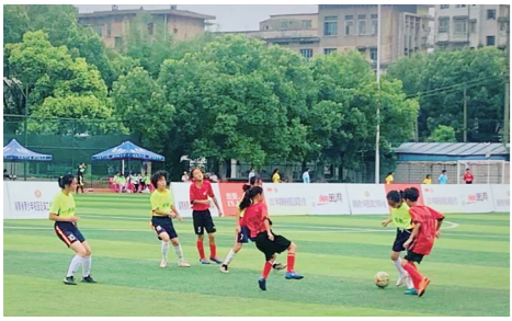
▲球场上的小将们。