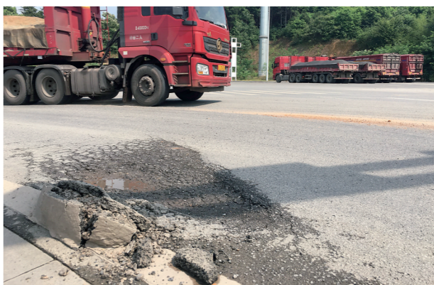
▲千亿大道与通用路交叉口,路面破损,多辆货车停靠路边。