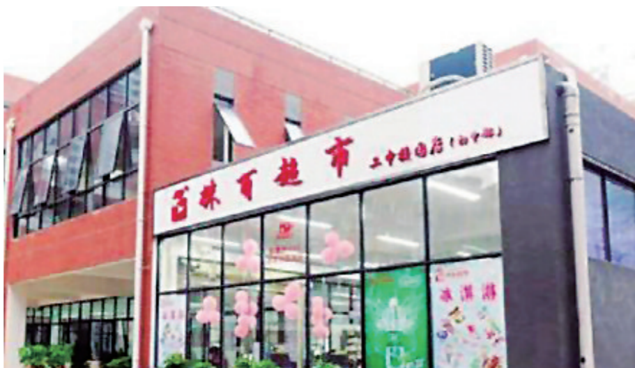
▲株洲市二中初中部校内的百味超市。(资料图)