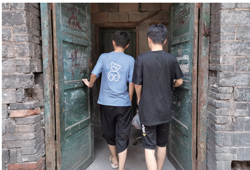
▲云龙、飞龙和父母生活在原湘安管件厂废弃食堂。

编号:001 姓名:云龙(化名),飞龙(化名) 性别:男 毕业学校:南方中学(云龙),九方中学(飞龙) 高考分数:云龙605分(物理类),飞龙514分(物理类) 高考志愿:武汉理工大学(云龙),湖南财经学院(飞龙)