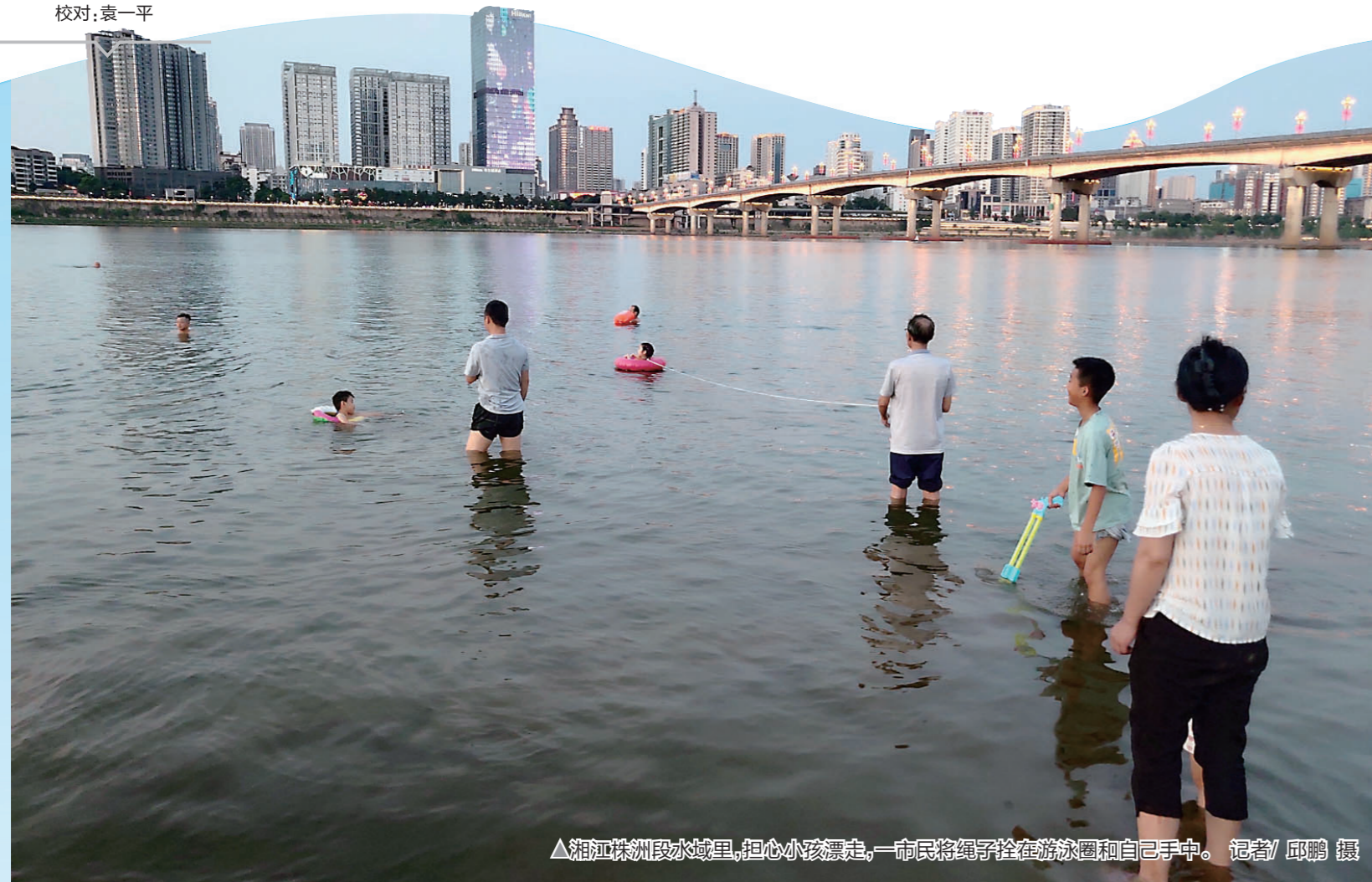
▲湘江株洲段水域里,担心小孩漂走,一市民将绳子拴在游泳圈和自己手中。