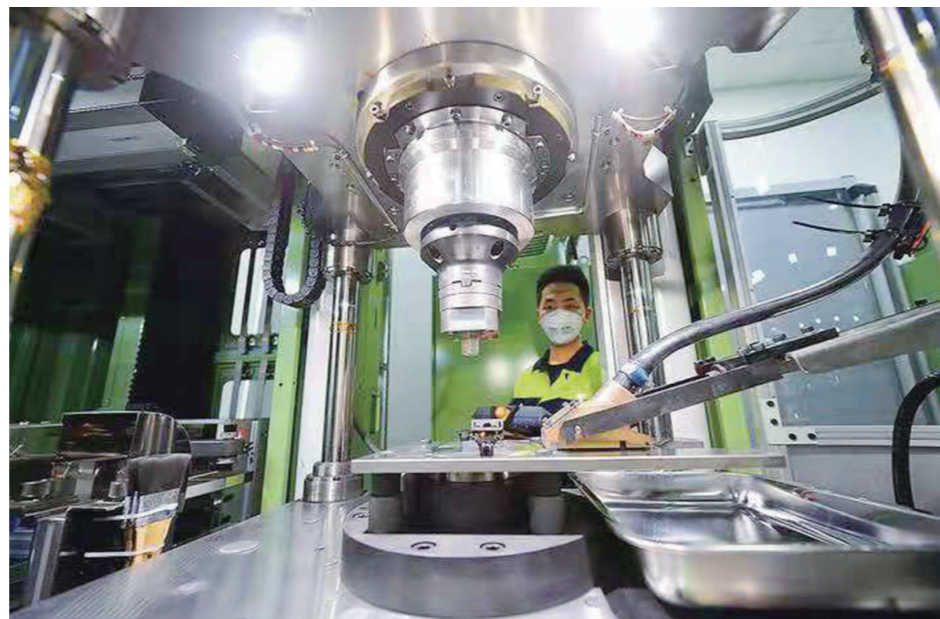
▲华锐精密车间自动化设备生产场景。

7月过半,基金中考成绩单尘埃落定。 在当前市场11765只基金中,上半年实现正收益的有9085只,占全部基金总数的77.15%。紧跟高景气成长、顺周期板块,最近半年不少基金都收益颇丰,其中部分基金收益甚至超过了50%,被誉为是投资界的“炸子基”。 值得一提的是,在这些当红“炸子基”的重仓股中,有不少株洲上市公司的身影。i问财数据显示,截至一季度,共有145只基金“恋”上株洲上市公司(大部分基金二季度仍未公布),累计持有株洲上市公司市值达37.36亿元。