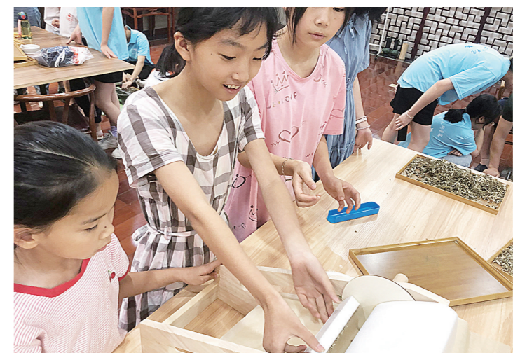
►夏令营里的孩子们正在制作艾条。

本报讯(株洲晚报融媒体中心记者/易楚瞳)练习传统书法、制作手工艾条、诵读国学经典……这个暑假,10岁的小媛和当地其他小伙伴第一次参加了“爱心守护·希望同行”留守儿童国学夏令营。 “留守儿童普遍缺少安全感和自我认知,容易出现自闭、叛逆、抑郁等心理特征。”活动主办方株洲九晚书院的素素老师对此深有感触,更想通过具体实践活动来帮助这些孩子。