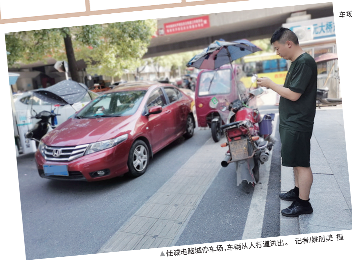
▲佳诚电脑城停车场,车辆从人行道进出。