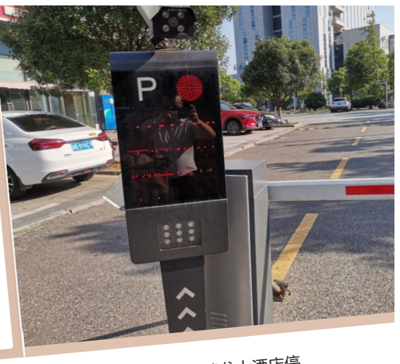
▲腾龙大酒店停车场无人收费系统。