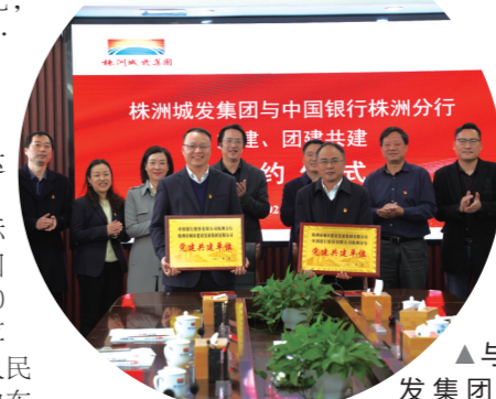
▲与株洲城发集团签订党建、团建协议

提供优质高效的国际结算服务。近5年来,中国银行株洲分行累计为300家外贸企业提供国际结算量69.9亿美元,提供跨境人民币结算120亿元,更是为中车株机、时代电气、时代新材建立了全球资金管理平台,帮助消减了结算成本。与此同时,针对汇率市场波动的风险,株洲中行充分发挥中国银行在全球金融市场上的专业优势,精准评估汇率风险。2017年来,共为株洲企业提供了10.5亿美元的外汇保值业务。