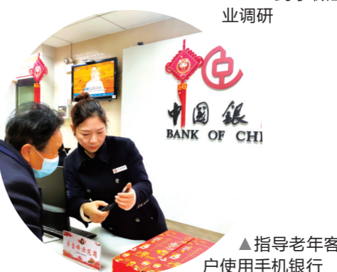
▲指导老年客户使用手机银行