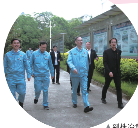
▲到株治集团调研考察,了解企业金融需求