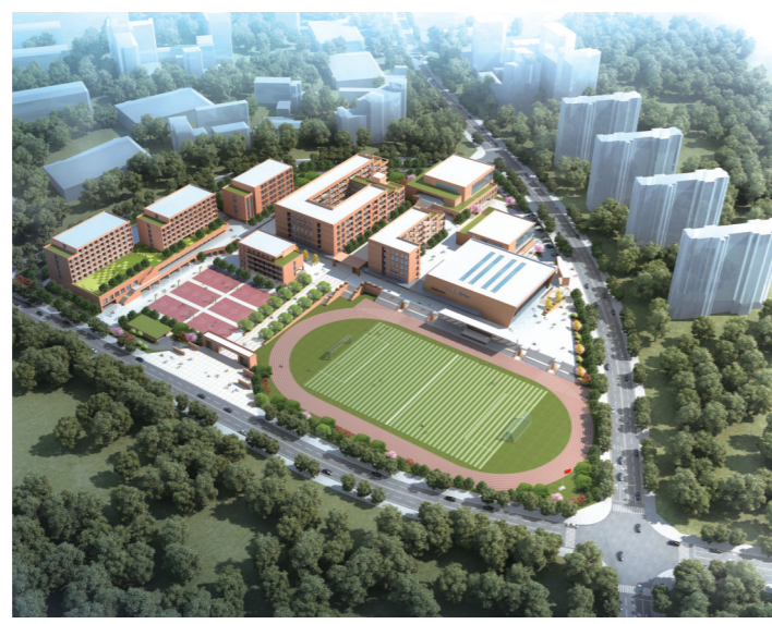
▲二中青龙湾中学效果图