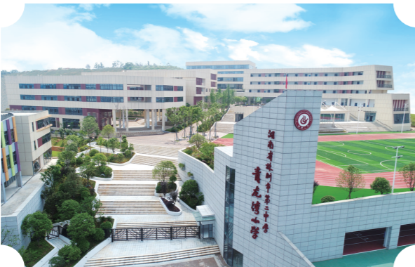
▲二中青龙湾小学实景

2021年二中青龙湾小学一年级、中学初一年级入学报名进行中!9月,二中青龙湾中学将利用二中青龙湾小学场地启动办学,先行招收初一年级4个班(200人),目前已启动入学报名工作,凡符合条件的青龙湾小业主可凭购房合同,到“株洲教育阳光平台”报名入学。