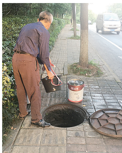
▲居民从“雨水井”打水。

“虽然井盖上有‘雨’字,但不是雨水井,是电力井。”一名分管市政维护的负责人称,为确保安全,工作人员已将井盖封严,并通知电力部门尽快进行维护。