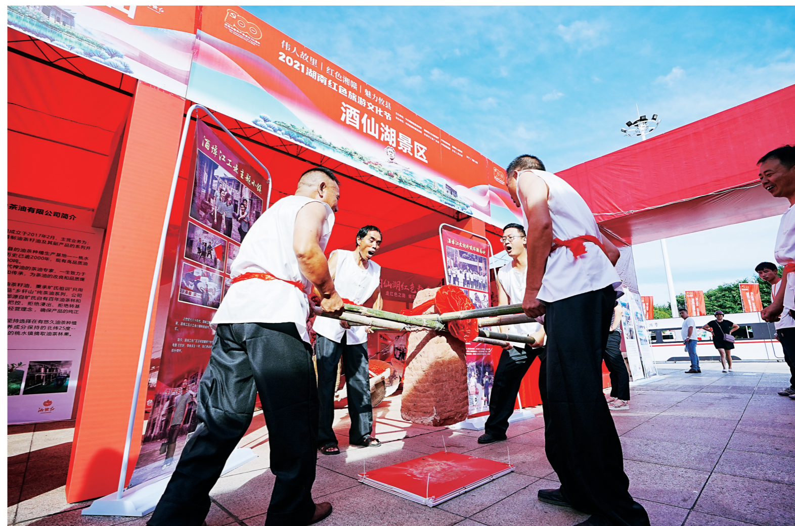
▲酒仙湖工作人员向游客展示景区酒埠江大坝修筑体验基地的体验项目。