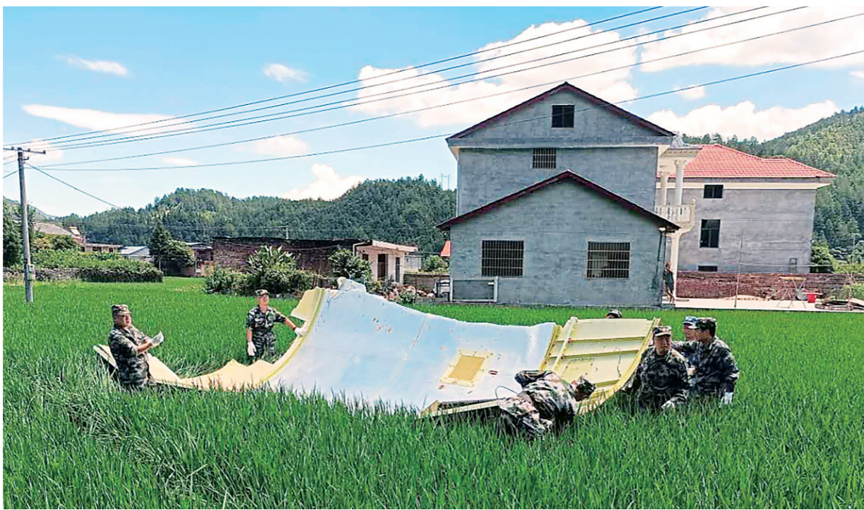
▲官兵在回收火箭残骸。