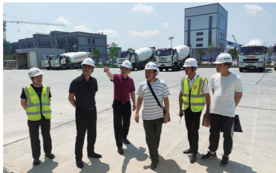
▲检查小组在现场进行检查

通过此次专项整治行动,整改了一批较大安全生产隐患,增强了企业安全管理人员的安全意识,规范了企业安全管理,全面提升了混凝土生产企业整体安全生产管理水平。(图/文 韩建强 组带)