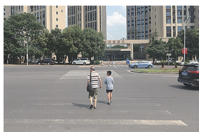
▲衡山东路斑马线磨损严重。

本报讯(株洲晚报融媒体中心记者/刘平)“在缺损的斑马线上,好几次差点被车撞到。”7月5日,有市民反映,天元区衡山东路多条斑马线磨损严重,让过往车辆的驾驶员难以识别,给过马路的市民带来安全隐患。