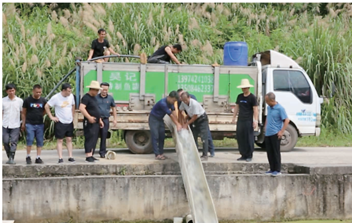
▲村民正在抛放鱼苗。