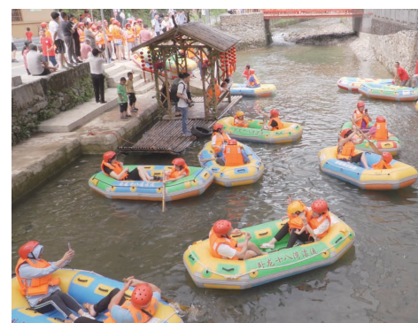
▲游客们体验漂流。

本报讯(株洲晚报融媒体中心记者/陈洲平 通讯员/刘鹏)日前,2021年茶陵县卧龙·首届湘赣边乡村旅游节暨第三届卧龙十八湾漂流节活动启动,近百名游客们坐上橡皮艇,在3公里长的漂流道上顺流而下,在惊险刺激的大峡谷漂流里感受击浪花、闯激流、过险滩的清凉与激爽。