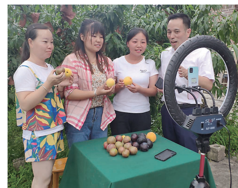
▲老师(右1)现场指导农产品直播带货。

本报讯(株洲晚报融媒体中心记者/黎世伟 通讯员/彭新平 刘嘉仪)7月3日,炎陵县下村乡云里村果园,农产品直播带货特训营学员们正在直播带货。学员们从枝头摘下新鲜的黄桃,边品尝边向镜头前推介。