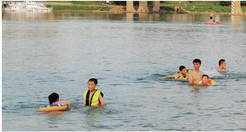
▲昨日下午,不少家长带着孩子在江中野泳。

测试结束后,学校特色发展中心参照国家健康体质测试评分标准,根据学校和学生实际情况,将