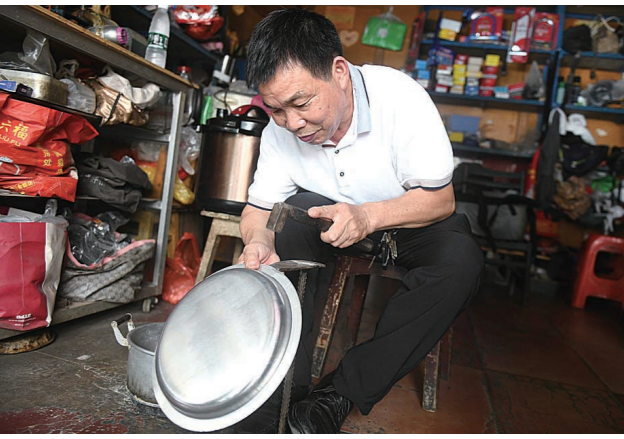
▲已经很少有人来补锅底了。