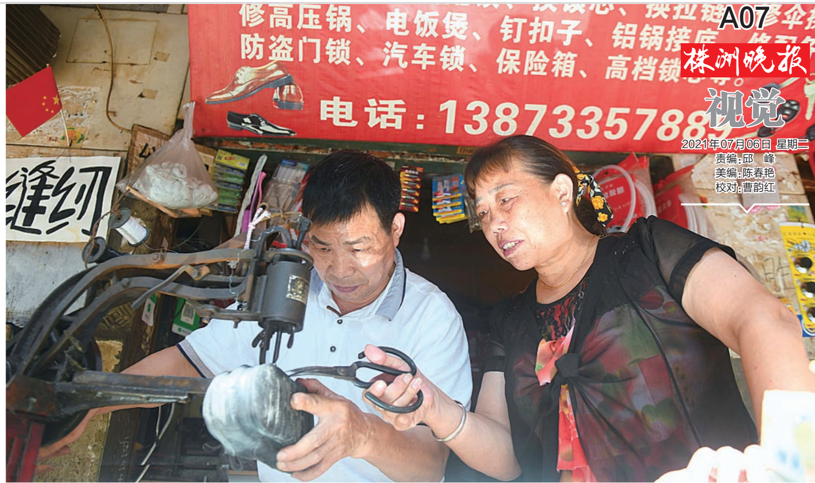
▲如今,修鞋的业务逐渐减少,为了生计,老谭和爱人学会了多种手艺。

7. 坚持属于自己的骄傲 坚持属于自己的骄傲,你是非常优秀的一个人,你会遇到更好的,每一个人都有着自己的尊严和骄傲,坚持属于自己的骄傲和尊严,勇敢的放下这段感情,以后的生活会更加潇洒。