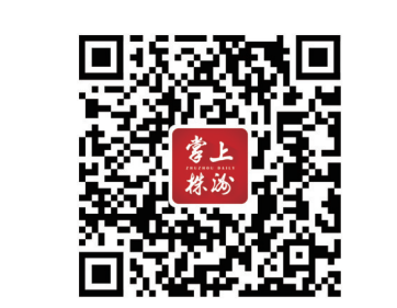
▲“白名单”完整版可扫码查看。二维码制作/张哲

家长如发现该区有违法违规培训机构和培训行为,可联系荷塘区教育局举报,共同为孩子们的营造良好的教育培训环境。咨询电话:0731-28477029。