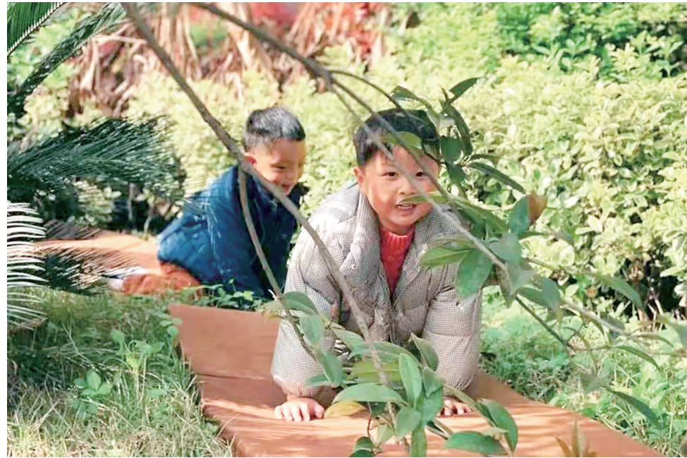
▲这些幼教机构大多强调儿童和大自然的亲近。