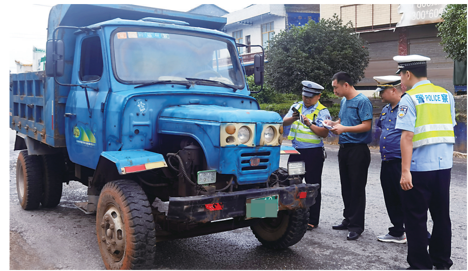
▲多部门联动整治现场。

在5天的专项整治行动中,20名联合执法人员分成4个小组,重点检查拖拉机登记上牌、整体式车架、货箱和机头等情况。