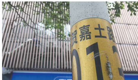
▲路灯杆上标注路名为“贺嘉土路”。

记者核实发现,该道路为一条临江道路,是从市区往雷打石镇的一条交通要道。该道路北端与滨江南路相接,从建宁大桥下一直延伸至株洲海事职业学校附近,再与008县道相接,长约9公里,沿线无路牌,通过地图软件也未搜索到路名。住在路边的居民称,该道路为河堤,建成时间已久,希望能有一个正式路名。