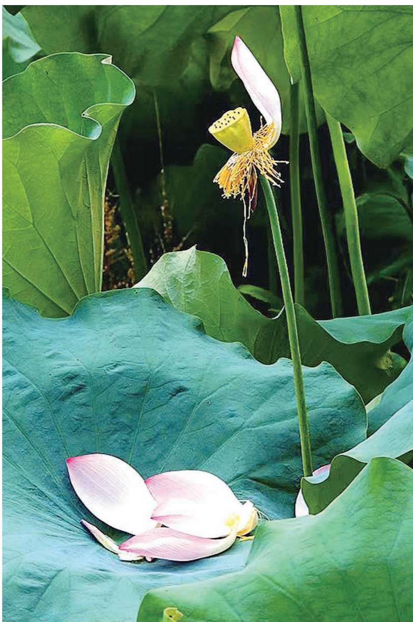
▲7月3日,盛夏的神农公园荷池,荷花瓣慢慢凋落,露出了嫩黄的莲蓬,就像一个芭蕾舞演员,仰头微笑。

比方说本周开始,整个城市虽然蓝天白云很美,但太热的天气还是让人有些受不了。所以,我们在防止身体中暑的同时,也别忘了照顾好自己的心情。