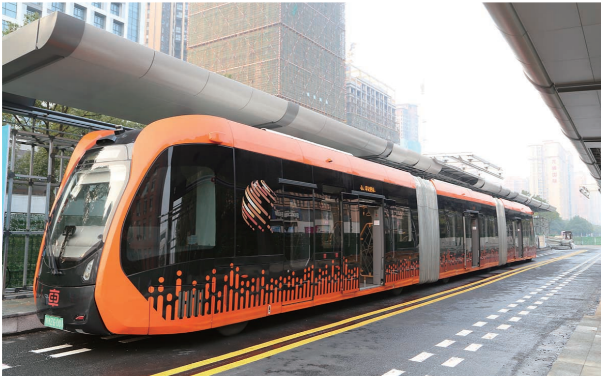
▲智轨在株洲开跑。(资料图)

本报讯(株洲晚报融媒体记者/易蓉 通讯员/朱灼 何应军)近日,国家知识产权局公布了第22届中国专利奖授奖名单,其中,株洲有6项专利获奖,包括1项专利银奖、5项专利优秀奖,获奖项目数量约占全省总量的四分之一。