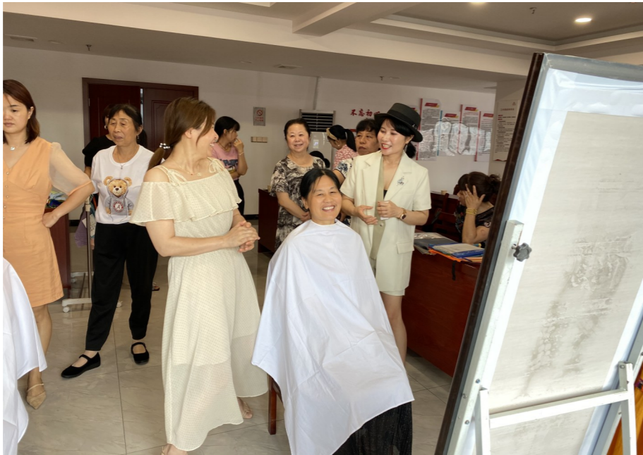
▲个人形象管理培训现场。

通告呼吁广大市民,不要购买、乘坐不符合车辆登记条件的电动三轮车、四轮车,并对违反本通告的行为进行举报,举报电话为市长热线“12345”。