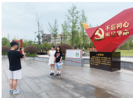
▲学生在“火车头”党建主题公园“打卡”拍照。

上午8点,湖南铁路科技职院新建成的“火车头”党建主题公园,不少师生“打卡”拍照。