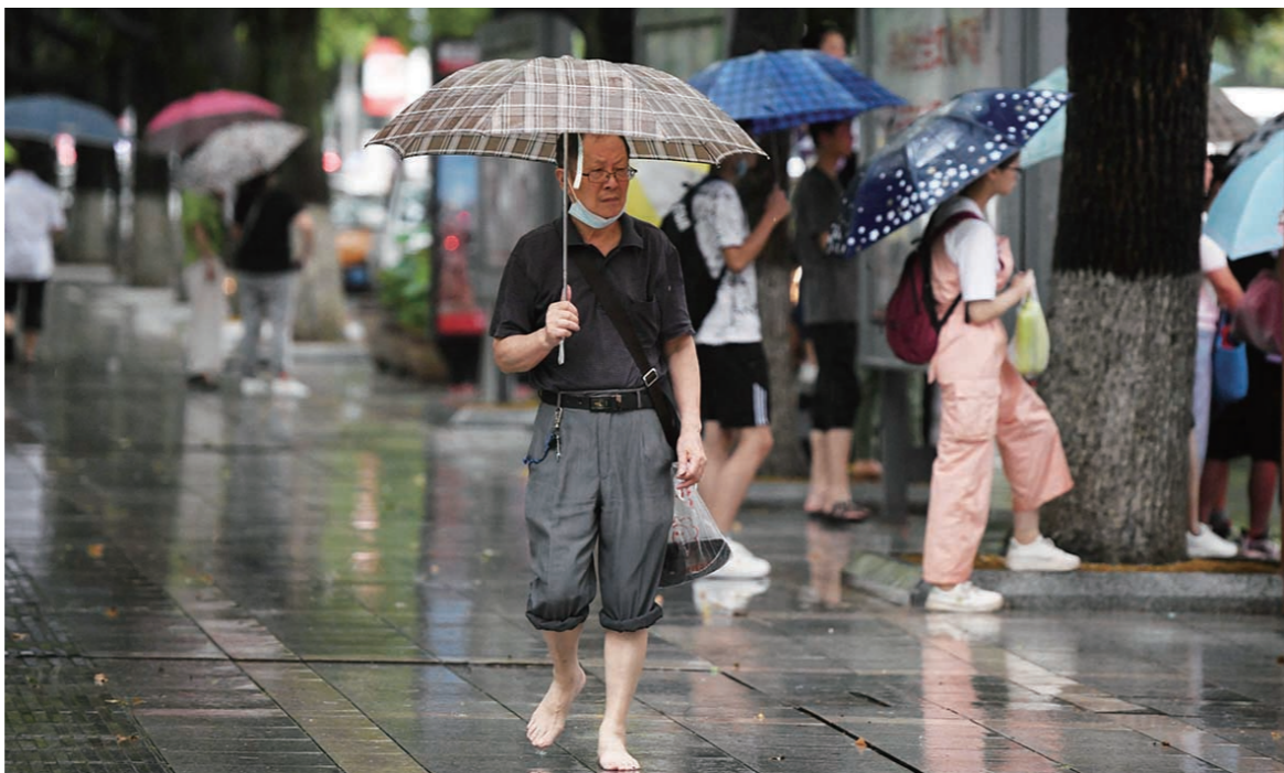
▲近日,天台路,在雨中,一位市民怕鞋子被雨淋湿,索性提着鞋子光脚走。