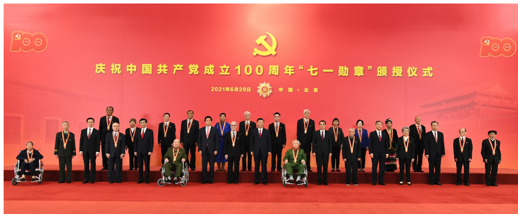
▲6月29日,庆祝中国共产党成立100周年“七一勋章”颁授仪式在北京人民大会堂金色大厅隆重举行。习近平等领导同志同“七一勋章”获得者合影。

▲6月29日,庆祝中国共产党成立100周年“七一勋章”颁授仪式在北京人民大会堂金色大厅隆重举行。中共中央总书记、国家主席、中央军委主席习近平向“七一勋章”获得者颁授勋章并发表重要讲话。