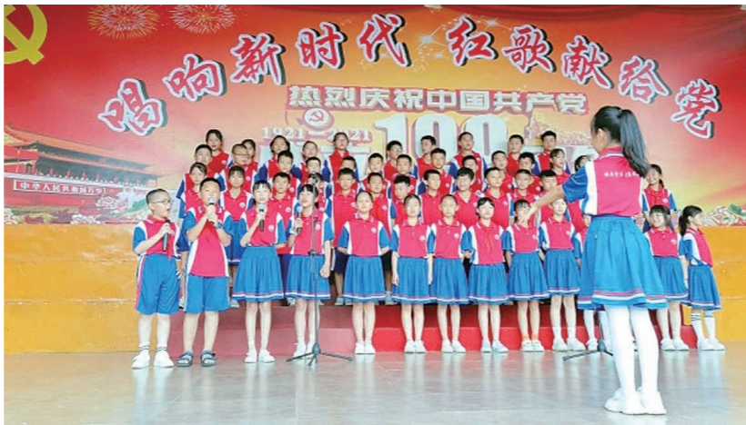
▲唱红歌,孩子们激情飞扬。

“1934年11月的一天,天寒地冻,北风呼呼。三名红军女战士路过了湖南郴州的一个小山村。为了不打扰村民,三名女战士敲开了村