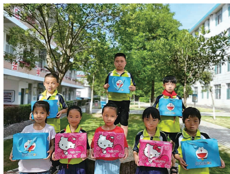
▲留守儿童高兴地收到了礼物。

本报讯(通讯员/吴青)近日,茶陵解放学校部分贫困留守儿童高兴地收到了一份特殊的礼物,这是一份迟来的“六一”礼物。