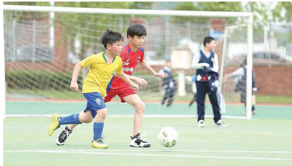
6月21日,荷塘区第七届“区长杯”青少年校园足球联赛落幕。美的学校共派出4支队伍参加比赛,夺得小学男子甲组冠军、小学男子丙组冠军。图为孩子们比赛精彩瞬间。