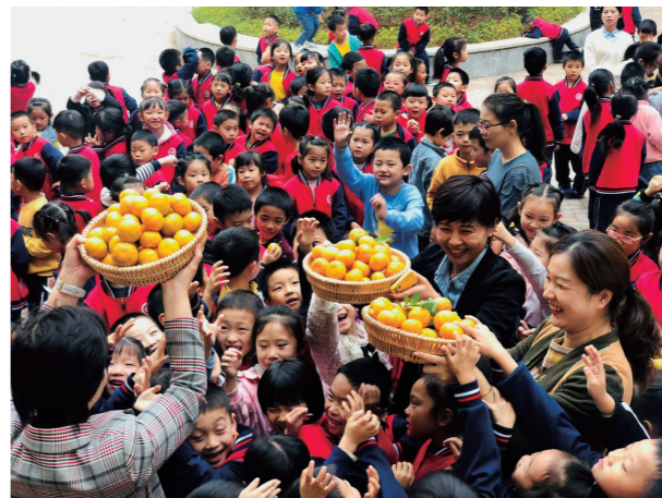
▲水果课程,曾校长带孩子们在校园里摘水果。