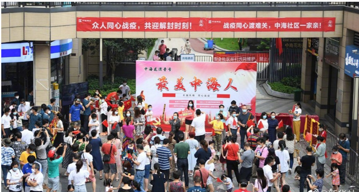
▲6月24日,广州市发布通告,有序恢复荔湾区芳村片区经济社会秩序。

尊敬的各位业主: 您好!非常感谢您长久以来对我司北大资源航空未名项目(北大资源未名1898,以下简称“未名1898”)的信任和支持。 目前,未名1898二号地块(1#-5#,7#-15#栋楼)已达到《商品房买卖合同》约定的交付(入住)条件,我司定于2021