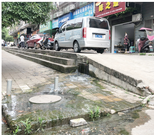
▲天台小区污水直排人行道路面。

本报讯(株洲晚报融媒体记者 易楚瞳)近日,市民吴先生向株洲晚报记者反映,天元区天台小区污水直排人行道路面,致使沿途道路臭气熏天,影响市容市貌。