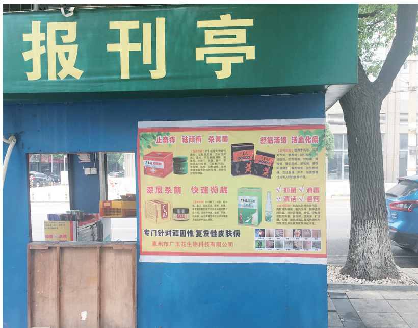
▲涠口区黄金东路与向阳北路交叉路口处,报刊亭变成小药店。

本报讯(株洲晚报融媒体记者 刘平)“针对顽固性复发性皮肤病……”6月22日,市民张先生在涠口区黄金东路与向阳北路交叉路口处发现,人行道上的报刊亭前放置有小喇叭,播放着药品广告;报刊亭内无书籍、