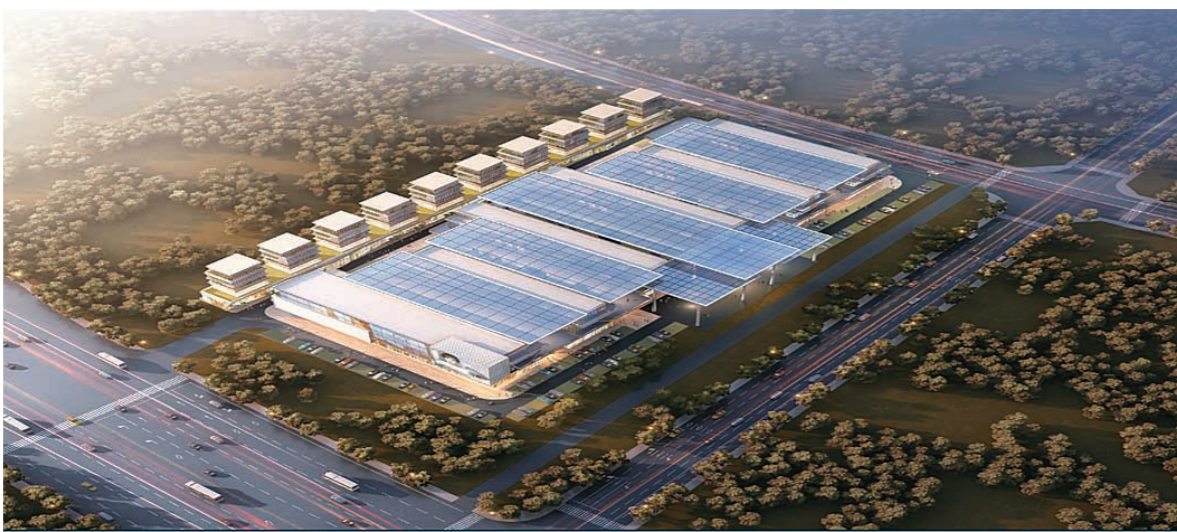
▲长株潭先进硬质材料产业园项目鸟瞰图。 业主单位供图

(图文由株洲市档案馆、醴陵市档案馆、醴陵市博物馆提供,株洲晚报融媒体记者 何春林 整理)