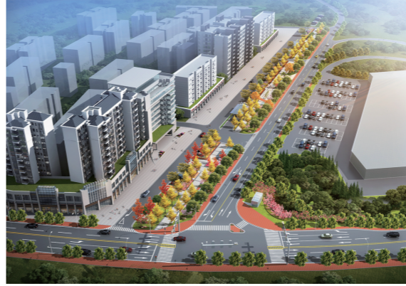
▲项目竣工后效果图。