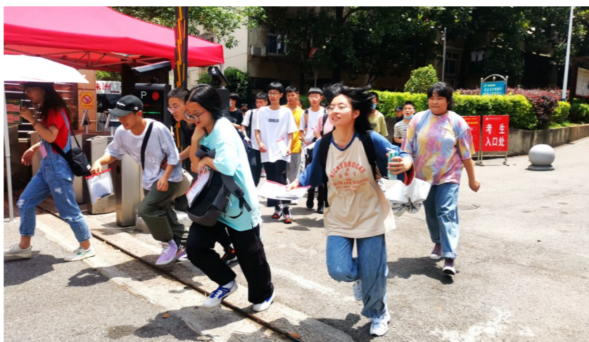
▲学考结束,考生们兴奋地跑出考点。

应届普通高中考生的学考合格性考试成绩,将作为高职院校单招录取时的重要依据之一。另外,今年学考查科科目要求更加规范。明确了通用技术、信息技术、音乐、美术、体育与健康五科,为省级命题、组考、评卷,市(州)组织实施的工作机制。