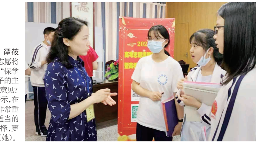
▲就填报高考志愿相关问题,专家为考生答疑。

子已高中毕业,但对人生和社会还缺乏了解,在填报志愿时难免产生一些疑虑。除了寻求教师的指导外,也需要得到家长的帮助。”专家表示,有些学生可能觉得不便于在学校公开讨论自己的想法,希望多多听取父母的意见。家长应注意引导子女从自己