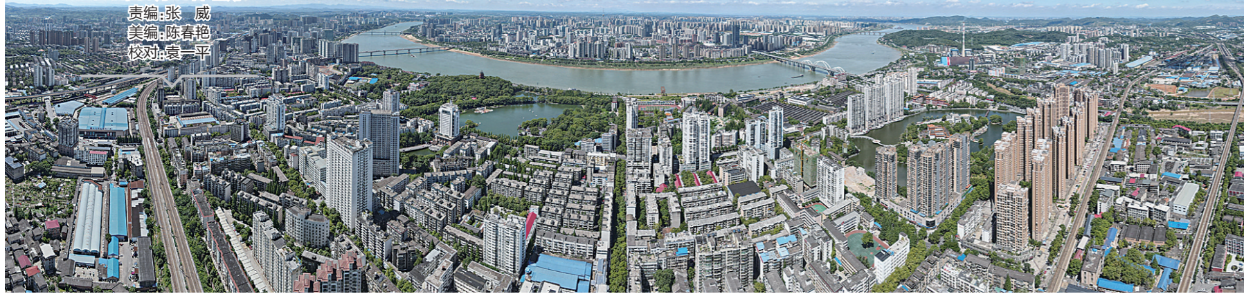
▲贺家路从人民路出发,直抵湘江边。