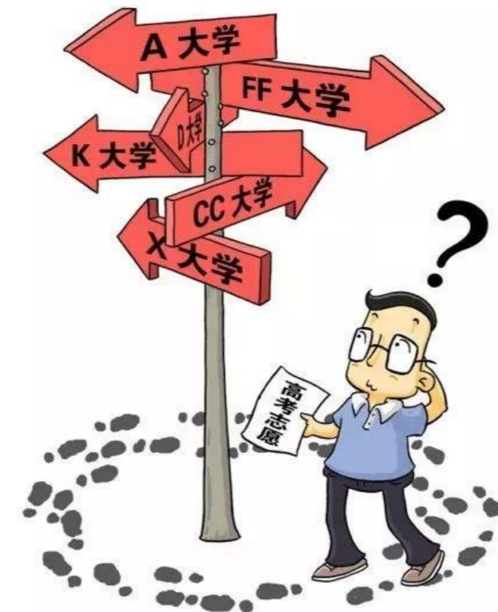
▲填报志愿,要找准自己的定位。

本报讯(株洲晚报融媒体记者 孙晓静)有意愿上军校的高考生看过来,2021年军校招生计划已出炉,今年共有27所军队院校在我省招生,计划招收普通高中毕业生746人,其中男生701人(物理类688人、历史类13人),女生45人(物理类44人、历史类1人)。 记者注意到,在这些军队院校中,国防科技大学在湘招生最多,名额为177人;其次是空军工程大学,名额为78人;第三为海军工程大学,招生49人。军校报考流程主要分为政治考核、填报志愿、面试