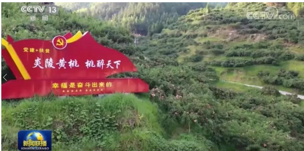
▲央视新闻联播报道炎陵黄桃发展情况(视频截图)

“邵阳的安全事故,给我们敲响了警钟,近段时间通过调查摸排,全市目前有60余辆电子礼炮车。”市应急管理局烟花爆竹安全监管科相关负责人告诉记者,目前,市应急管理局已经将上级文件精神传达到各县市区监管部门,迅速采取综合措施管控电子礼炮。