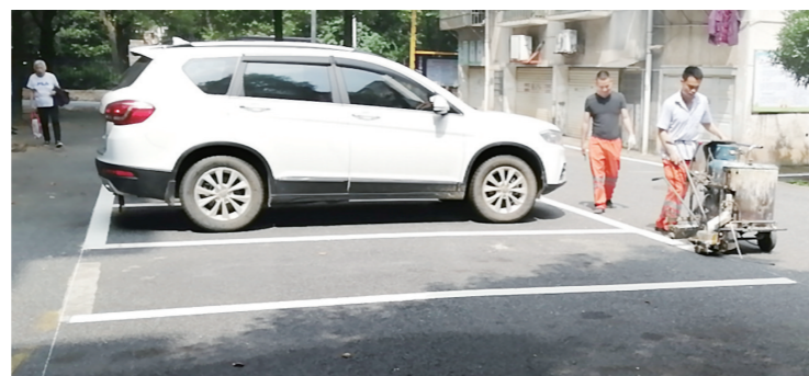
▲工作人员在施划停车位。

很快,近6万居民通过网格微信群陆续收到了关于整治的消息。在这场行动中,除了检查组现场检查打分,居民与企业的满意度占比五成,直接影响结果。被判定为不合格的物业公司将“出局”。