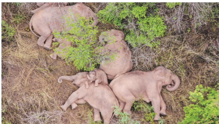
▲6月7日在昆明市晋宁区夕阳彝族乡拍摄的野象(无人机照片)。

记者从云南北迁亚洲象群安全防范工作省级指挥部了解到,截至6月7日16时50分,象群持续在