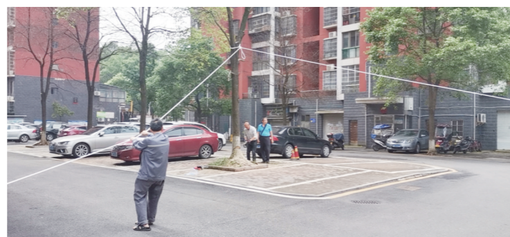
▲整治行动中,工作人员处理死树。