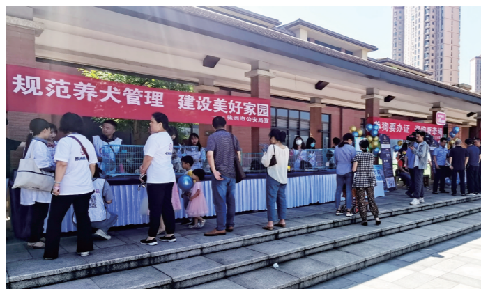
▲文明养犬进社区地推活动现场。