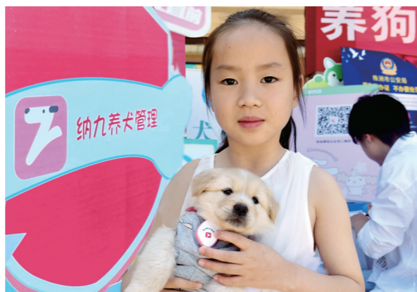
▲女孩小曾给新玩伴戴上狗牌。

本报讯(株洲晚报融媒体记者沈全华 通讯员 谭哲)6月5日上午,阳光明媚,天元区滨江南路湘水湾小区居民张女士牵着一只博美犬,来到我市文明养犬进社区地推活动首站现场,为自家的爱犬申领“电子身份证”。5月1日实施的《株洲市城市养犬管理条例》明确规定,养犬必上户,遛狗必牵绳。