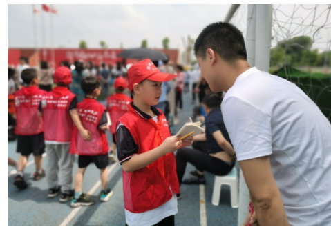
▲图为校园记者采访场景。

本报讯(校园记者辅导老师 贝国华)6月1日,何家坳枫溪学校举办闪闪红星向未来“六一”艺术节。