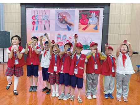
▲自己做香囊,孩子特开心。

此次制作中药香囊活动,让校园记者们感受到中医文化的博大精深,也让中医的种子在每一个孩子心中生根发芽。