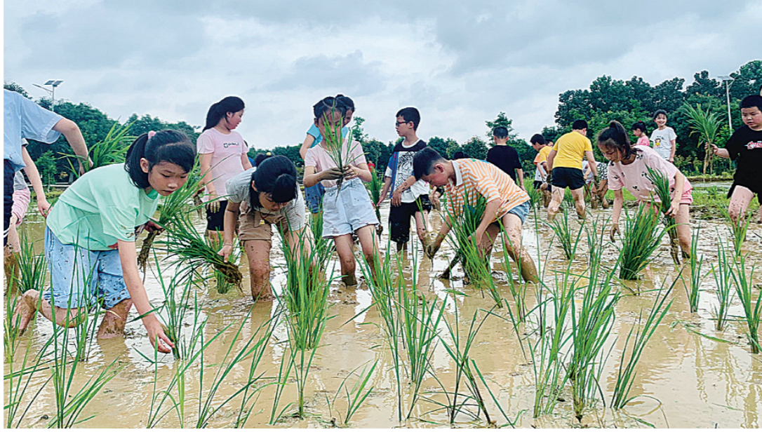
▲孩子们体验劳动的艰辛与快乐。