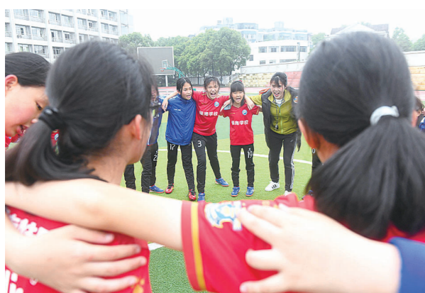
▲比赛结束后,老师带着队员们喊着“加油!加油!”。