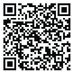
▲扫码看采访视频。 制作:谢慧