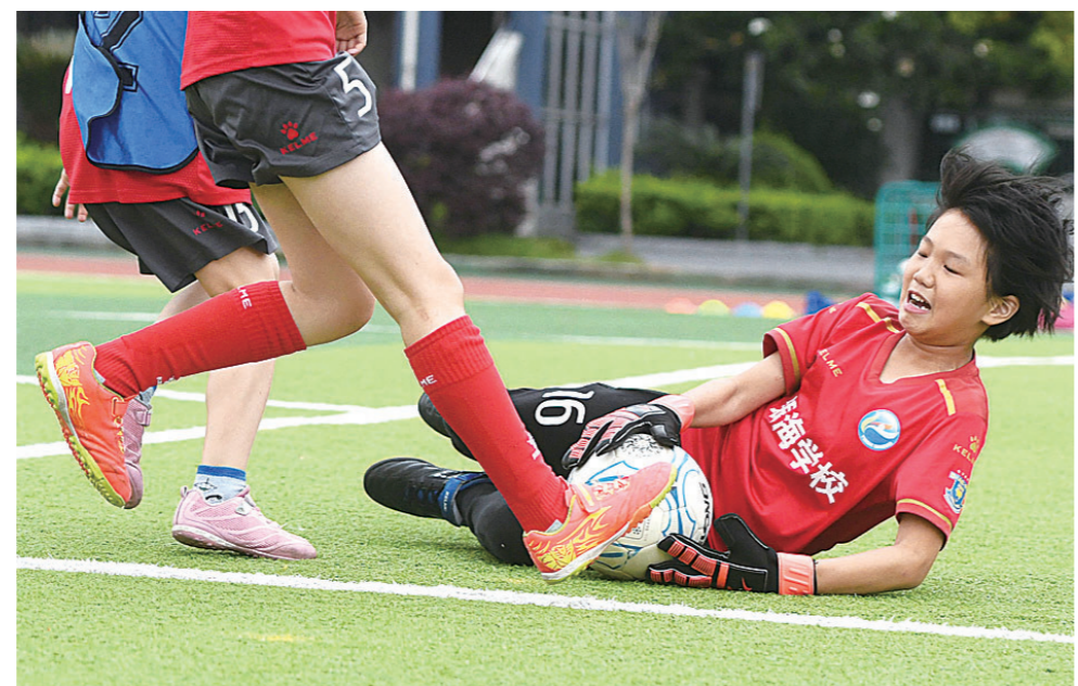
▲奋力扑救的守门员。