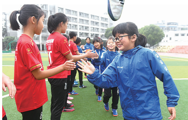
▲两队击掌互相致意。