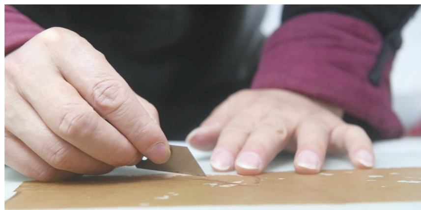
▲用刀片修复打湿后的新旧纸张