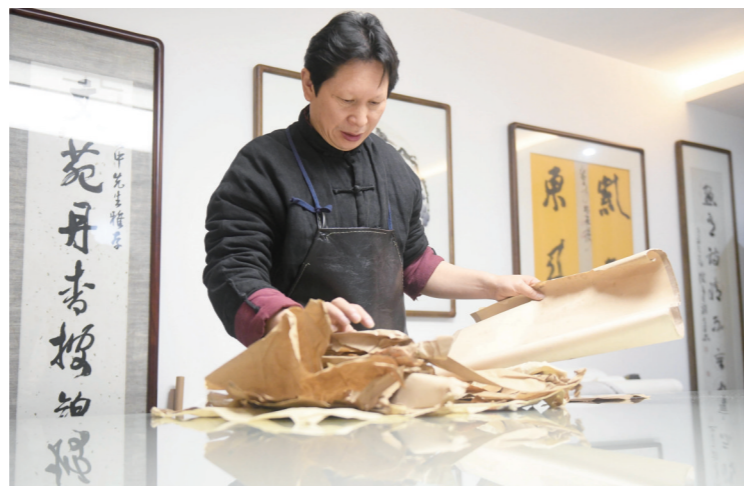
▲在修复前,寻找匹配的纸张