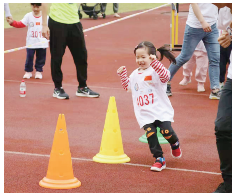
▲一名小朋友绕障碍物跑。

本报讯(株洲晚报融媒体记者何春林)昨天上午,“奔跑吧·少年”儿童青少年主题健身活动之幼儿体能系列赛在我市举行。340多名3岁到6岁的孩子相聚市体育中心,迎接“六一”国际儿童节。