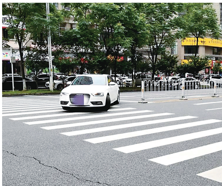
▲天元区珠江北路,少数车辆违法掉头。

对路边违停车辆,将通过球形电子警察抓拍处罚,并强化现场执法力度。对严重影响通行的违停车辆,将拖至停车场处理。