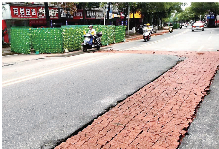
▲文化路施工更换老旧管线。

目前,荷塘交警大队已安排充足警力,早晚高峰在文化路附近值守,疏导交通,保障安全。请车辆及行人提前规划路线,绕行或慢行。