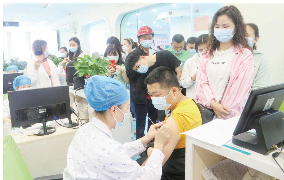
▲5月25日下午2时,在天元区嵩山街道社区卫生服务中心,居民排队接种新冠病毒疫苗。