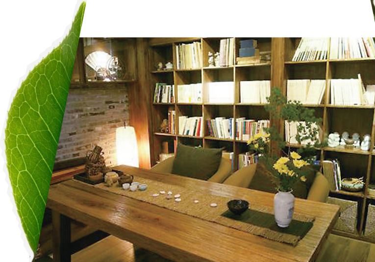
▲各具特色的茶馆。