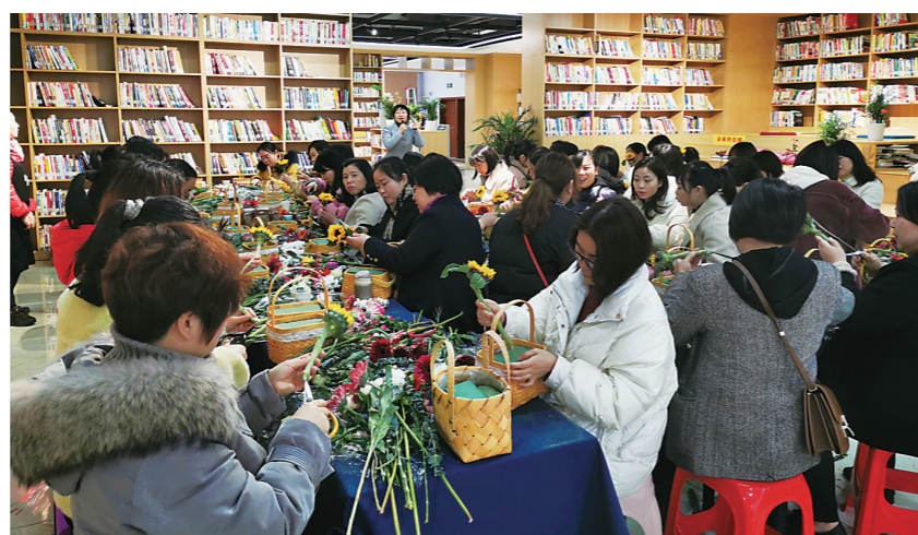
▲“株洲书房”的花艺课堂,吸引众多市民参与。

市图书馆上述负责人介绍,为进一步打造株洲新的文化名片,我市计划一年建立1到2个主题鲜明的“株洲书房”,如妇女儿童、红色文化等。同时,在覆盖人群、功能分区、藏书种类、活动安排等方面突出特色化建设,让市民就近就能享受高品质阅读,让书香株洲弥漫至城市的每一个角落。