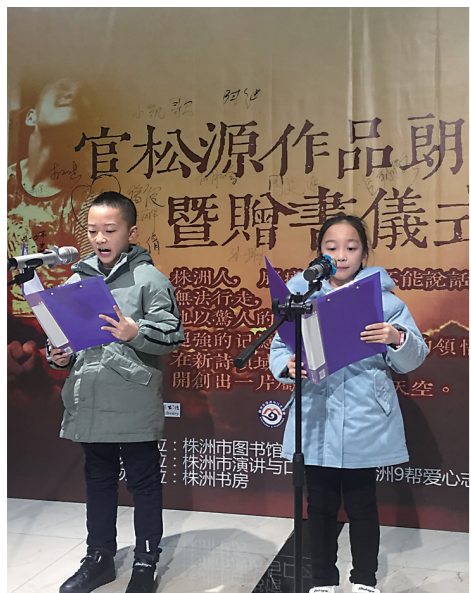
▲在“株洲书房”举办的主题读书活动。

据统计,目前,全市共建有9个公共图书馆,26个分馆,106个流通点,16个拥有自主知识产权的24小时智能书屋,1561个农家书屋和机关企业图书馆(阅览室)以及阅读空间、“一房一品”更具品牌特色的“株洲书房”,基本实现了通借通还,成功构建了株洲特色的“总分馆制”。到2020年,形成了城区“15分钟阅读圈”。其中,像市民中心分馆、规划展览馆分馆、十里春风分馆、消防救援支队分馆等藏书多、功能全,成为职工和市民经常打卡的读书圣地。