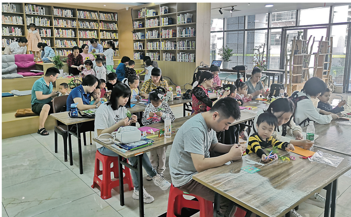
▲在“株洲书房”举办的亲子手工活动。